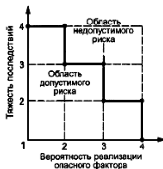
Рисунок Б.1 - Диаграмма анализа рисков

Если точка лежит на границе или выше границы, фактор учитывают, если ниже - не учитывают.